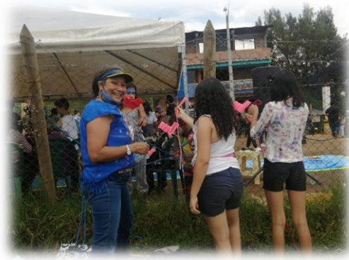
Mujeres por el agua