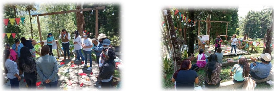
Encuentro de mujeres rurales

ENCUENTRO MUJERES RURALES este espacio permitió juntar temas femeninos que promueven el amor propio, el respeto a la naturaleza de la mujer alrededor del ciclo menstrual desde una mirada epistemológica del mito y el tabú.