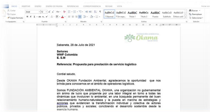
Carta de presentación institucional

Carta de presentación institucional , esta herramienta le permite a la fundación, hacer acercamiento a otras entidades para la solicitud de espacios, agradecimientos y comunicaciones externas que contribuyen a oficiar las relaciones.