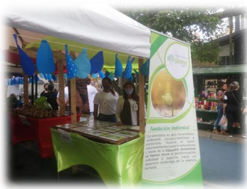
Participación en feria de educación ambiental

MUJERES POR EL AGUA la fundación se junta por la causa defensora del agua potable en comunas de la ciudad con actividades lúdicas, artísticas y de sanación como un forma de decir que el patrimonio hídrico es fundamental para la vida.