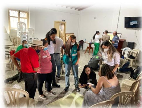
Encuentro reflexivo por la biodiversidad